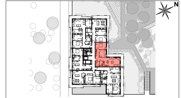
Croisement du Chemin du Clos Langlet et de l'allée Alexander Fleming 91130 - RIS-ORANGIS