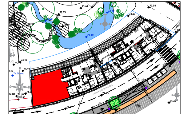
ILOT 9 AVENUE DES BERGERES