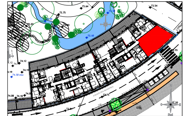
ILOT 9 AVENUE DES BERGERES