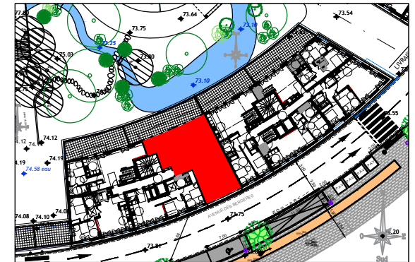
ILOT 9 AVENUE DES BERGERES