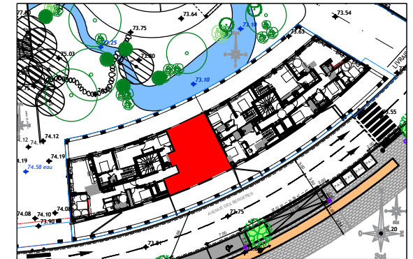
ILOT 9 AVENUE DES BERGERES