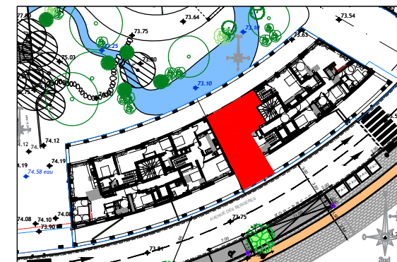
ILOT 9 AVENUE DES BERGERES