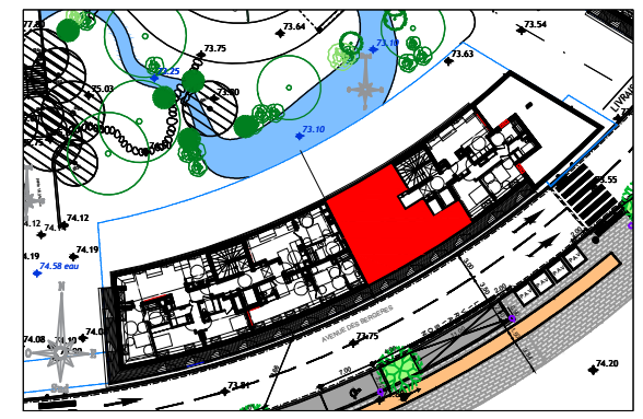
ILOT 9 AVENUE DES BERGERES