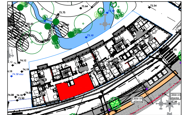
ILOT 9 AVENUE DES BERGERES