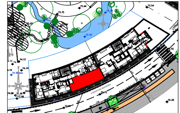
ILOT 9 AVENUE DES BERGERES